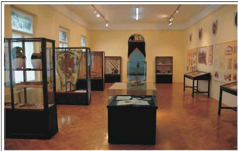
Нова поставка Историјској одељења