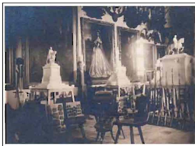
Изглед сталне поставке Музеја из 1928. године (сала иза изложнице)

Вредна и ретка пушка, заведена под инвентарским бројем И306, јесте пушка бечког ковача и