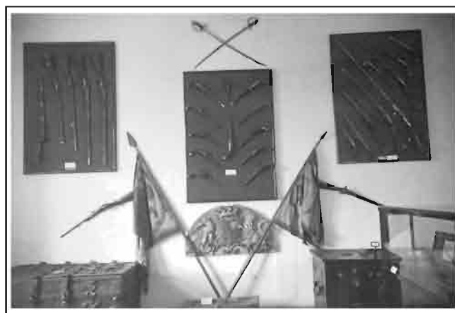
Поставка Музеја пре пресељења 1966. године у садашњи простор