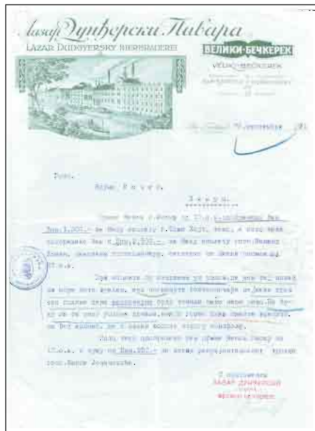
Меморандум пиваре Лазара Дунђерског

После привредне кризе почела је да расте потрошња пива, али до избијања Другог светског рата није достигнута производња из 1927. године. Пивара је, према званичној статистици из 1910. године, запошљавала 26 радника, и то 23 мушкарца и 3 жене.