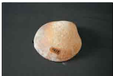
50. Neobrađena polovina Spondylus školjke. Prečnik 8,5 cm. Inventarni broj 4051.