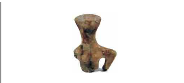
15. Antropomorfna figurina. Trougaono lice, urezana ogrlica ispod vrata, naglašene grudi, ruke savijene u laktovima. Visina 11 cm. Inventarni broj 4082.