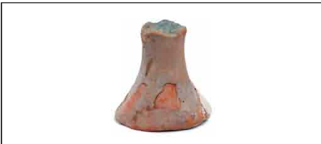
14. Stopa pehara. Visina 11 cm, prečnik zvonastog dna 9,2 cm. Inventarni broj 3884.