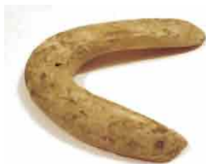
37. Predmet nepoznate namene od Spondylus školjke, u obliku slova V. Jedan krak perforiran. Dužina kraka 7,5 cm i 6,5 cm. Inventarni broj 4023.