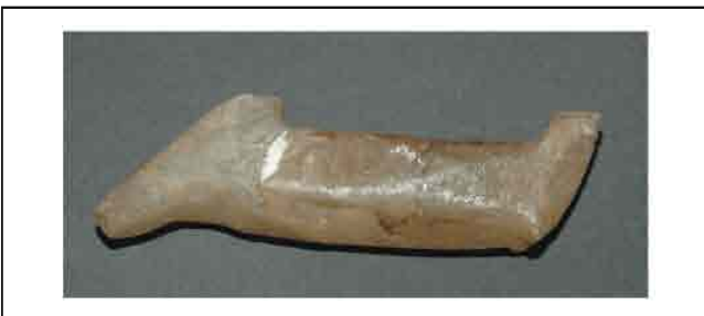
28. Zoomorfni amulet od alabastera. Visina 6 cm. Inventarni broj 4059.