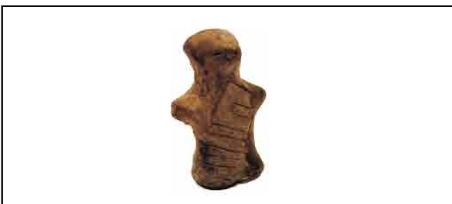
16. Antropomorfna figurina. Glava sumarno modelovana, kratki patrljci, na telu urezani meandri. Visina 5,7 cm. Inventarni broj 4083.