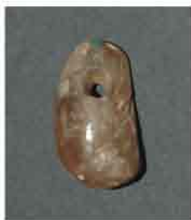
48. Perforirani privesak od ćilibara. Dužina 2 cm. Inventarni broj 4070.