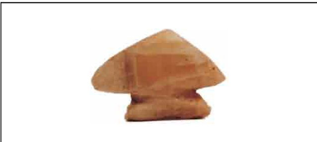
26. Kameni amulet, u obliku pečurke. Visina 4 cm. Inventarni broj 4063.