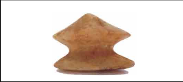
24. Amulet od alabastera, u obliku pečurke. Visina 5,5 cm. Inventarni broj 4061.