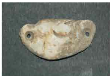
49. Privesak od Spondylus školjke, sa dve perforacije. Dužina 3,6 cm. Inventarni broj 4026.