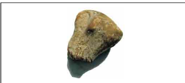
17. Glava antropomorfne figurine. Trougaono lice sa plastičnim nosom. Visina 3,7 cm. Inventarni broj 4084.