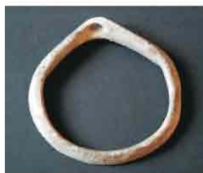
40. Narukvica od Spondylus školjke. Prečnik 6,2 cm. Inventarni broj 4048.