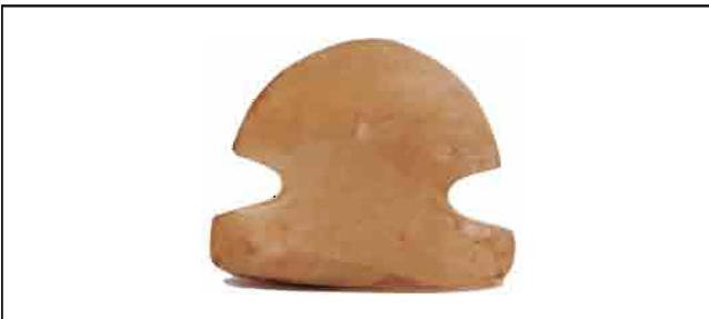
25. Amulet od alabastera, u obliku pečurke. Visina 5,3 cm. Inventarni broj 4062.