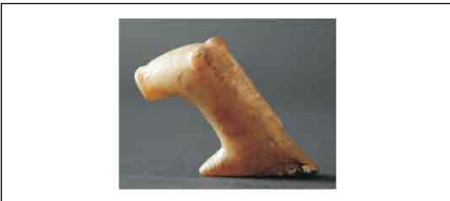
27. Zoomorfni amulet od alabastera. Visina 6,2 cm. Inventarni broj 4057.