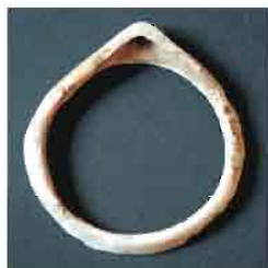
38. Narukvica od Spondylus školjke. Prečnik 5,2 cm. Inventarni broj 4016.