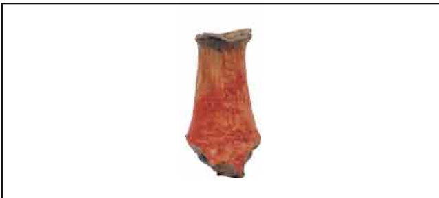
13. Stopa pehara. Visina 10 cm. Inventarni broj 3885.