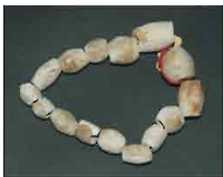
36. Ogrlica od Spondylus školjke, sa 15 perli cilindričnog i bikoničnog oblika. Inventarni broj 4054.