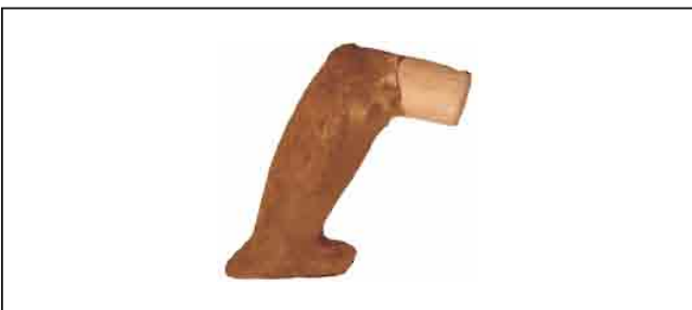
29. Zoomorfni amulet od alabastera. Visina 7 cm. Inventarni broj 4058.