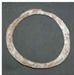
41. Narukvica od Spondylus školjke. Prečnik 7,8 cm. Inventarni broj 4011.