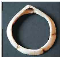
39. Narukvica od Spondylus školjke. Prečnik 5,3 cm. Inventarni broj 4049.