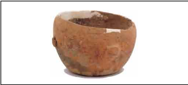
12. Zdela, poluloptasta, sa četiri dugmetasta nalepka na truhu. Visina 7,5 cm, prečnik oboda 4,5 cm, prečnik dna 4,8 cm. Inventarni broj 3889.