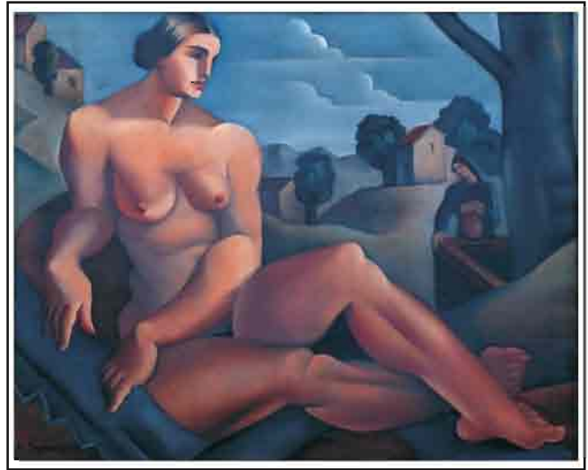
Сава Шумановић, „Женски акти“, уље на њлајћну, 85 x 100 цм, 1926.

ној и уједначеној колекцији. Ипак је то колекција слика која, својом заступљеношћу репрезентативних