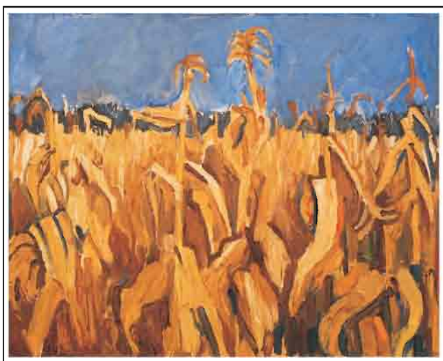
Феја Сорејивић, „Кукуруз“, уље на њлајну, 80x 100 цм, 1972.