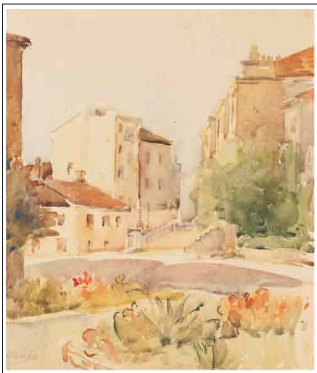
Стојанка Јасика, „Градска ведуш“, акварел, 31 x 25 цм, 1970.

уметничких имена и разуђеношћу поетског израза и израженог индивидуалног ликовног сензибилитета, чини једну престижну ликовну поставку посвећену ствараоцима који су, сходно својим моћима, допринели стварању специфичности савременог сликарства као сведочанства о развоју уметности овог поднебља, без чијег удела сагледавање целине умет-