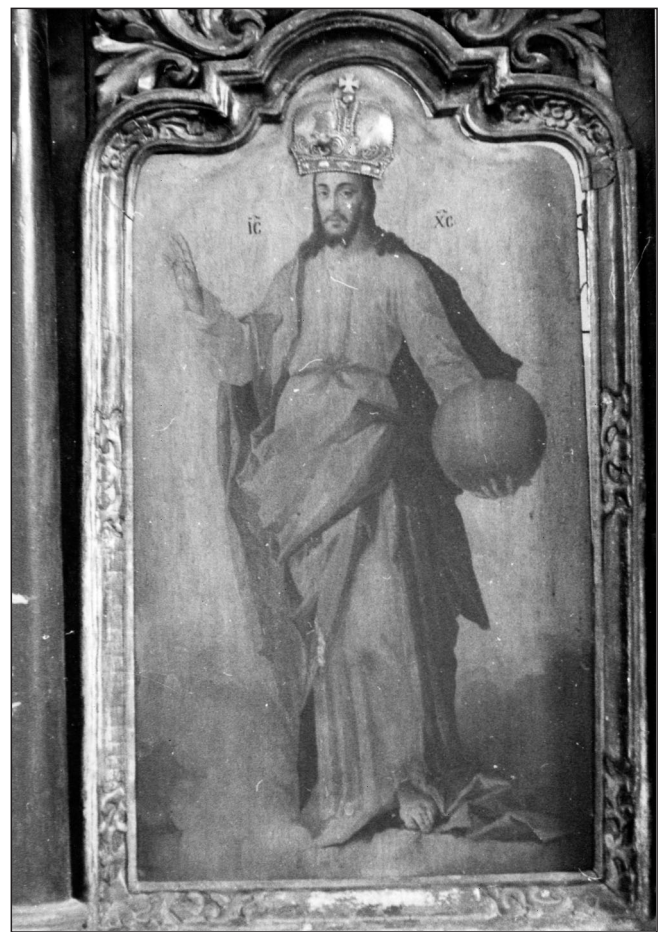
▲ Слика 4. Исус Христјос, иресијона икона