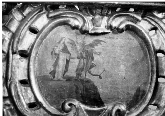
▲ Слика 9. Кушање Христa