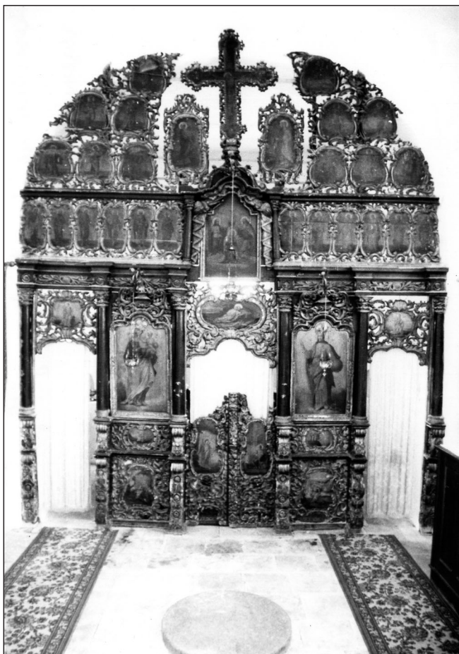
Слика 2. ▲ Иконостас црква Свeтoг Лукe у Купинoву