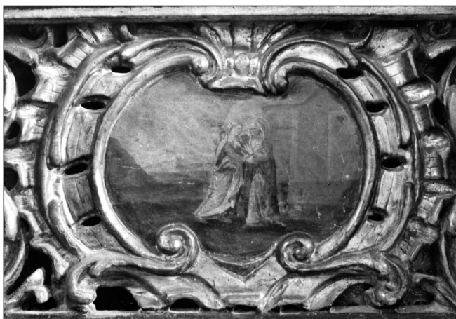
Слика 8. ▲ Сусрeт Мaриje и Јeлисaвeтe