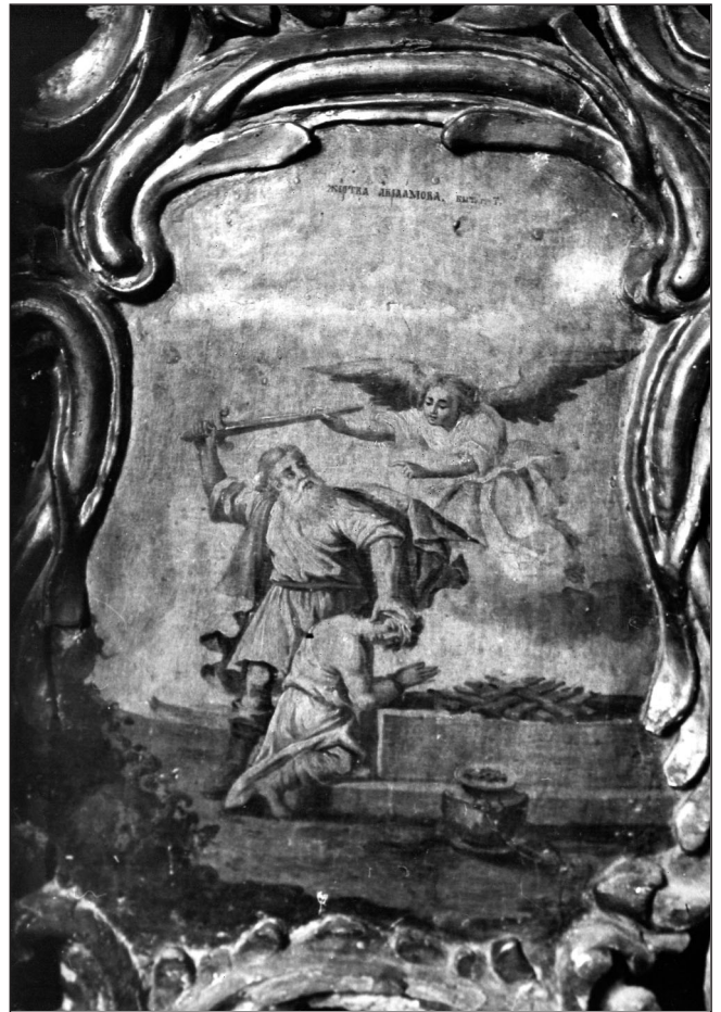
▲ Слика 7. Жртва Аврамова