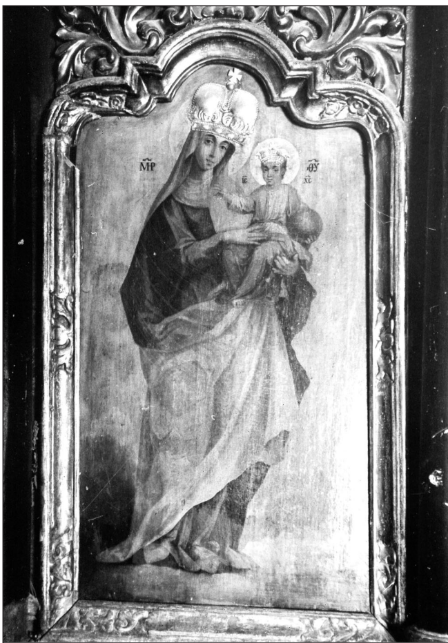
Слика 3. ▲ Богородица са малим Христјом, иресијона икона