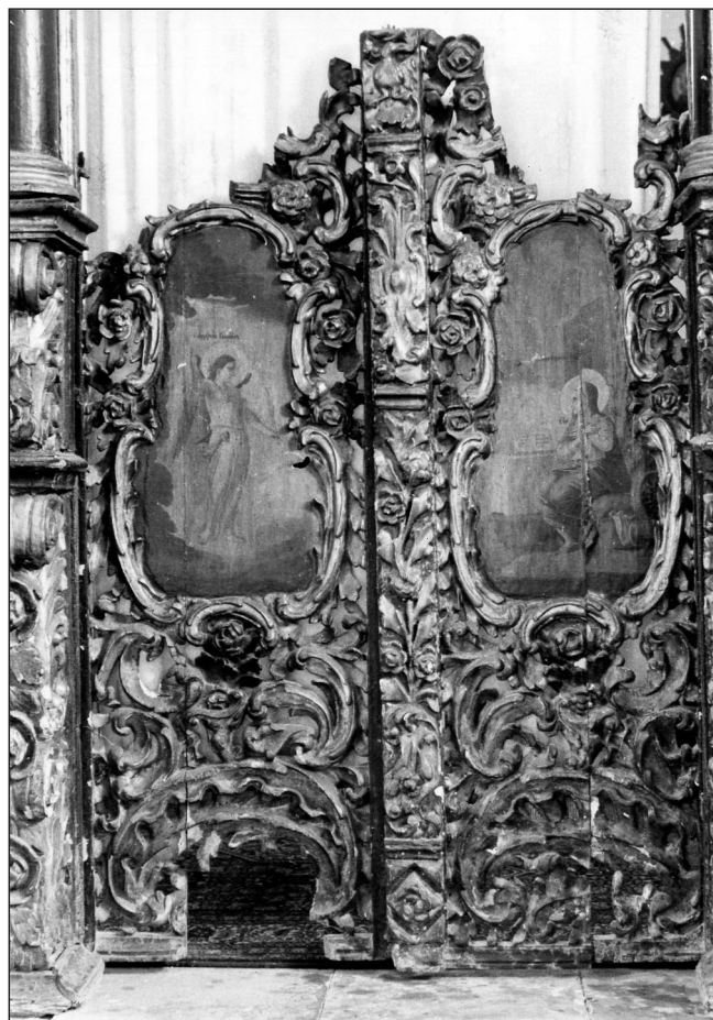
▲ Слика 5. Царске двери