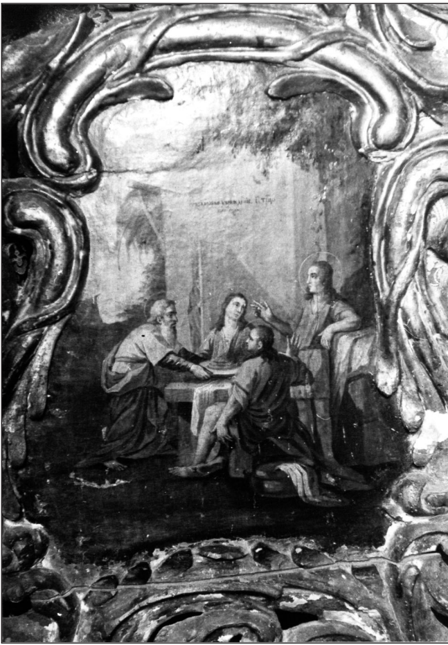
Слика 6. ▲ Гостољубље Аврамово