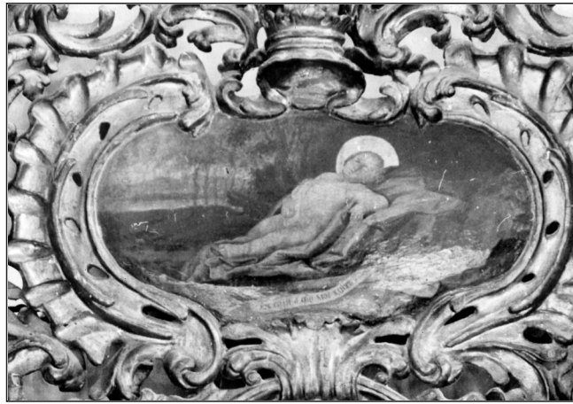
Слика 10. ▲ Недремано око